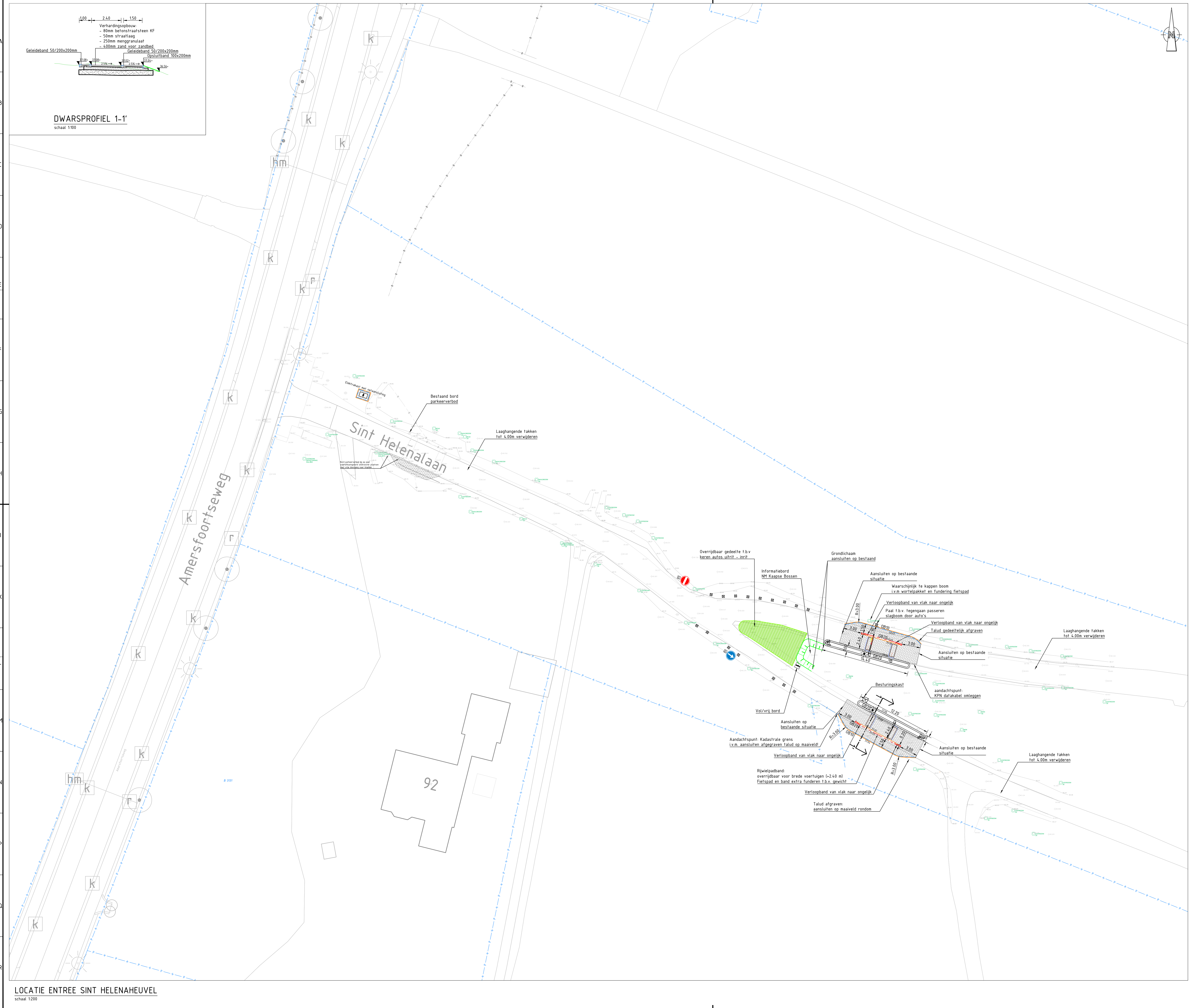
LOCATIE ENTREE SINT HELENAHEUVEL schaal 1:200

Opmerkingen - Maten in meters en dimensies van materialen in mm, tenzij anders aangegeven. - Coördinaten in RD-stelsel en hoogtematen in meters t.o.v. N.A.P.